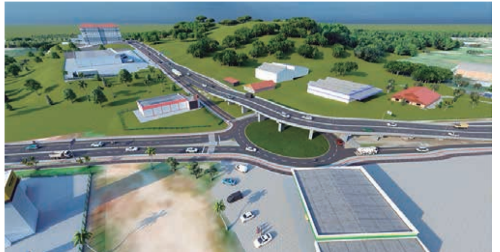
Os recursos para a execução da obra são provenientes da operação de crédito internacional do Fonplata

As obras da terceira etapa do Binário da Avenida Santos Dumont compreendem a continuação das etapas I e II do sistema viário. A terceira etapa engloba a duplicação da Avenida Imigrantes Poloneses, de 950 metros de extensão, e a construção de um viaduto em curva na altura da rótula entre a Avenida Imigrantes Poloneses e a rua Miguel Patrício de Souza. A estrutura terá quatro faixas, cerca de 300 metros de extensão e 6,5 metros de altura. O prazo de execução da obra será