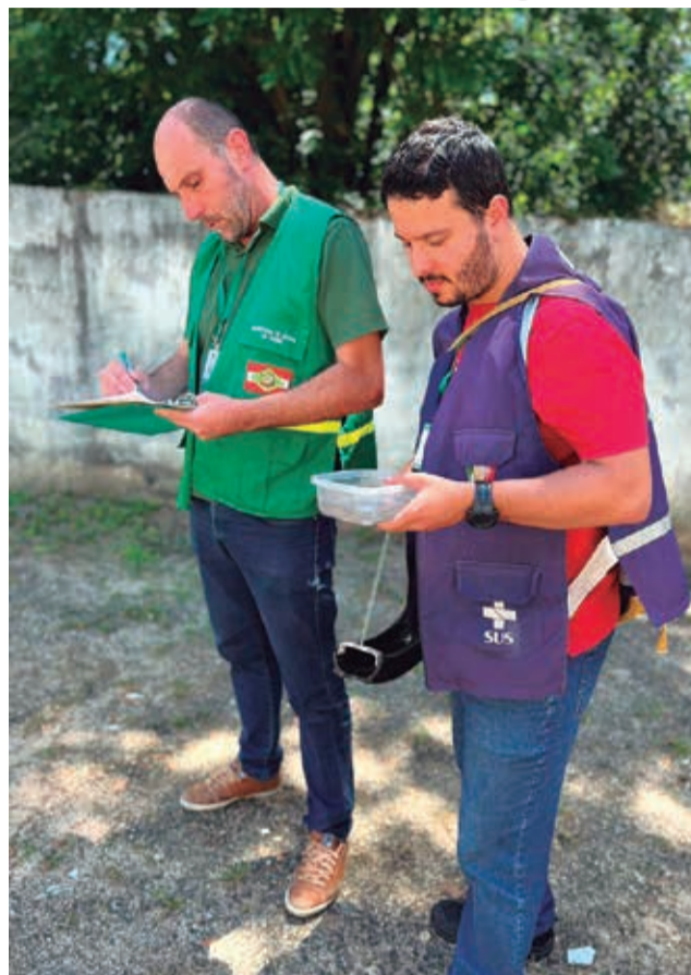
Agentes vistoriam armadilhas constantemente no município

A Prefeitura de Maracajá vem reforçando as ações de combate à dengue durante todo o ano. Os agentes de Vigilância Sanitária e Endemias fazem vistorias na cidade constantemente, com o objetivo de conscientizar a população para a eliminação dos