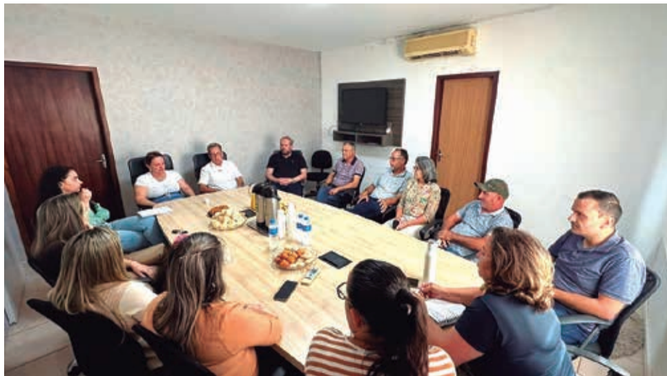
Preparativos estão sendo discutidos entre o Executivo e Legislativo de Maracajá

Os números foram contabilizados pela equipe que está 24h disponível para atendimento aos motoristas e passageiros.