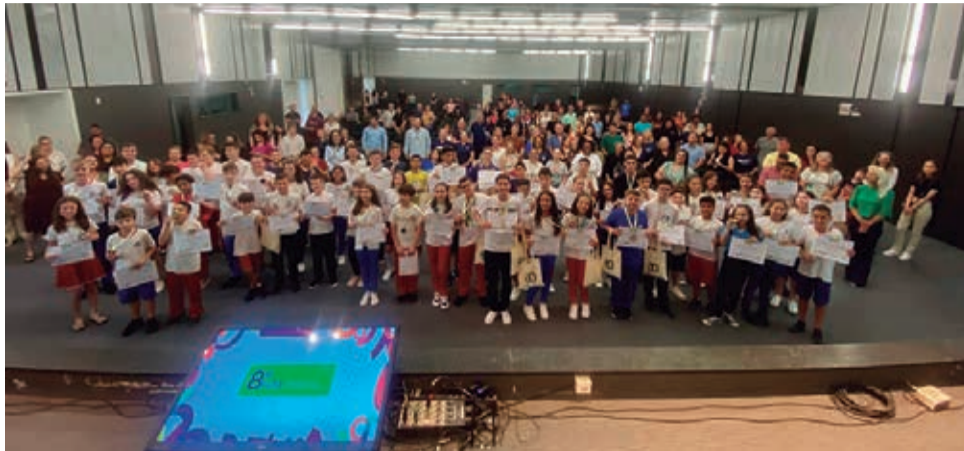
Entrega de medalhas e certificados ocorreu nesta terça-feira, na sede da entidade empresarial