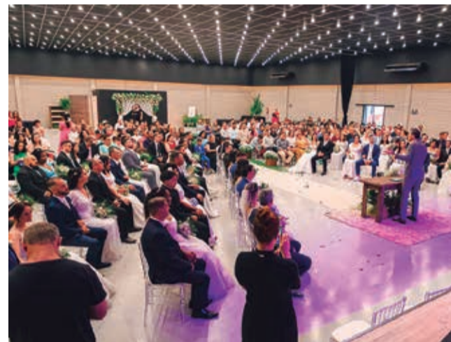
Aproximadamente 50 casais oficializam a união nesta semana

O casamento também foi marcado pela emoção e pela lembrança da importância dos casais viverem relacionamentos saudáveis, construindo famílias fortes e comprometidas com Deus e com a sociedade.