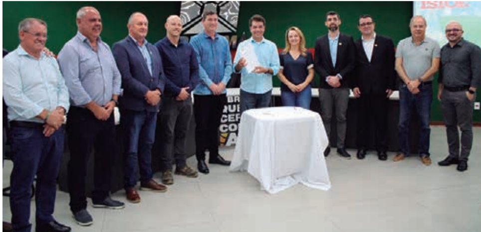
A nova legislação flexibiliza as normas de uso do solo nessas margens em áreas urbanas consolidadas

O diagnóstico que embasou a legislação analisou seis bacias hidrográficas: Rio Maina, Rio Sangão, Rio Linha Anta, Rio Criciúma, Rio Cedro e afluentes do