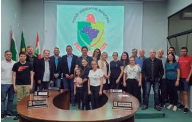
Cooperativa contribui no desenvolvimento sustentável das famílias rurais